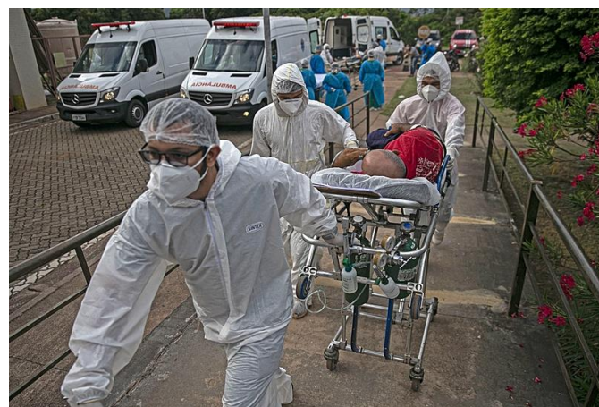
Brasil é o segundo no mundo com mais mortes pela covid-19 - Tarso Sarraf / AFP

Fonte: Internacional de Trabalhadores da Construção e da Madeira - ICM